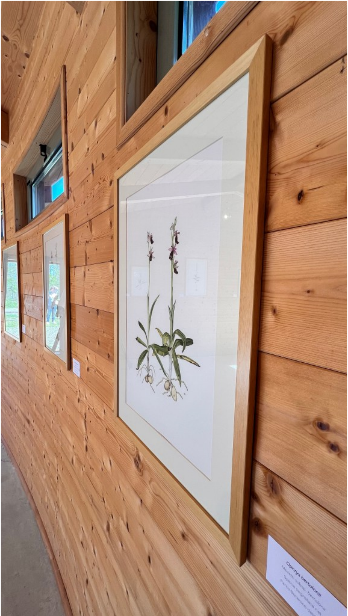
Ophrys bertolonii Substrato: sabbie. Bertoloni Specie segnalata nel Parco Butanico della