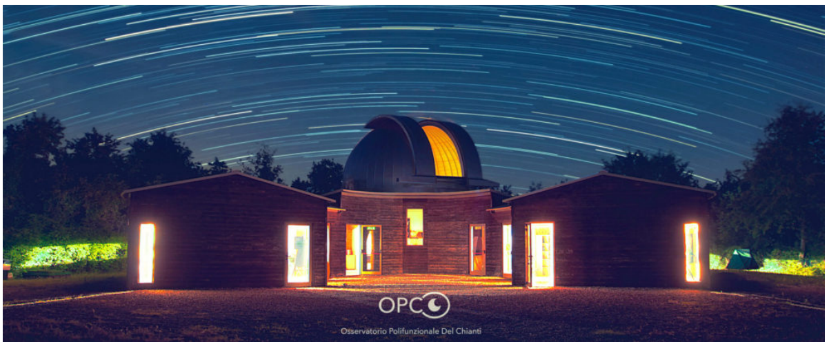
Star trail OPC