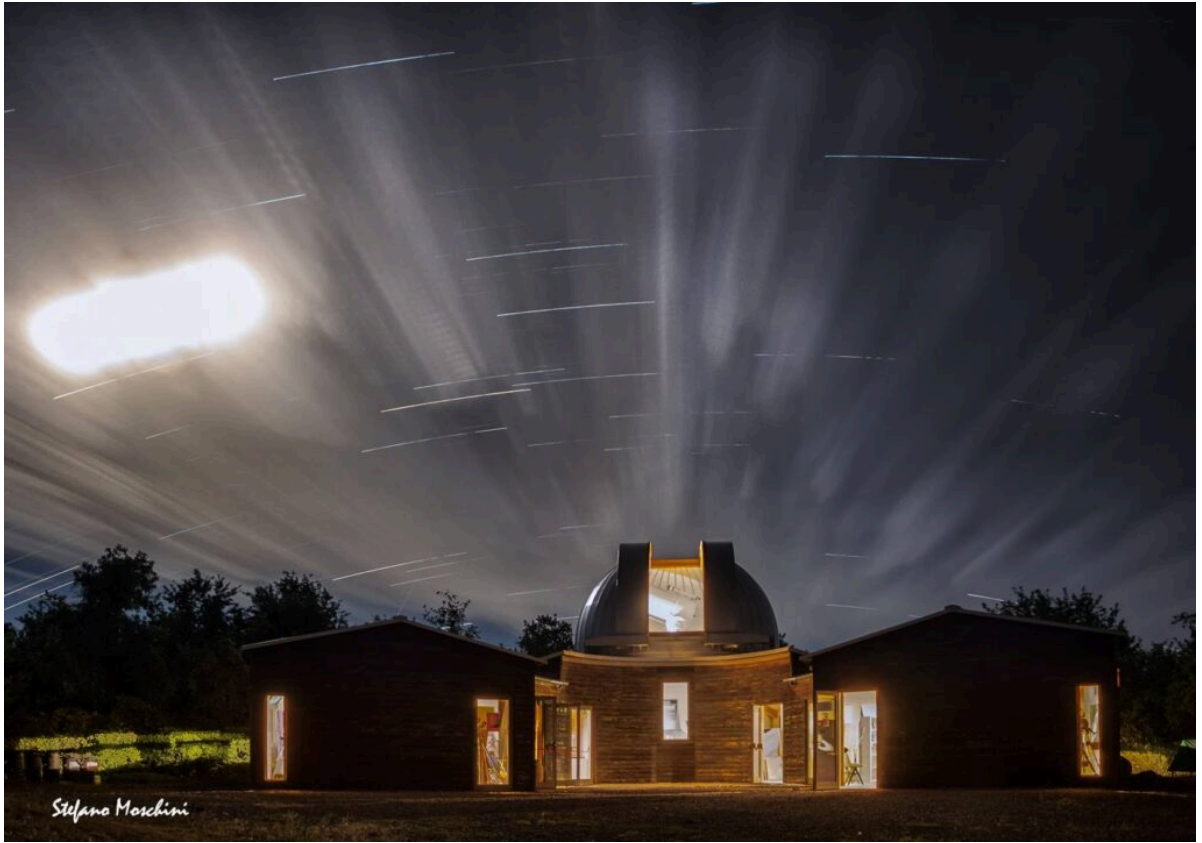
Luna trail, Stefano Moschini