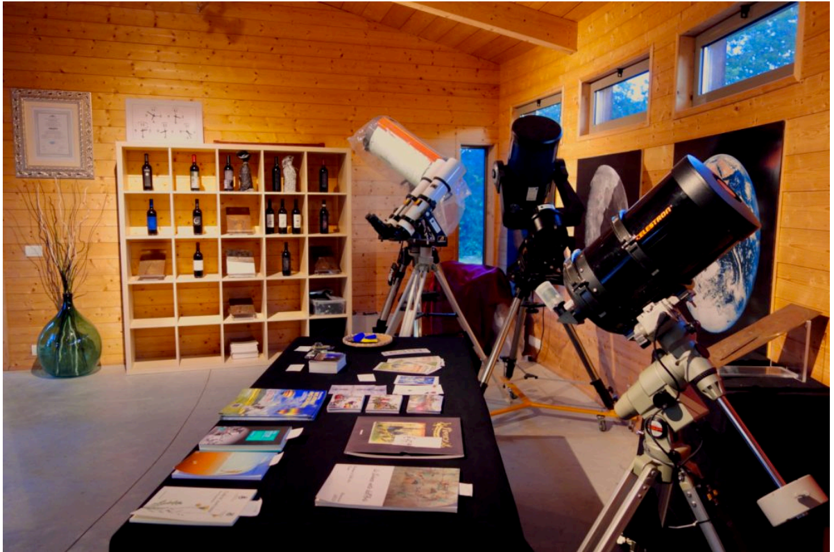
Sala accoglienza con telescopi degli astrofili