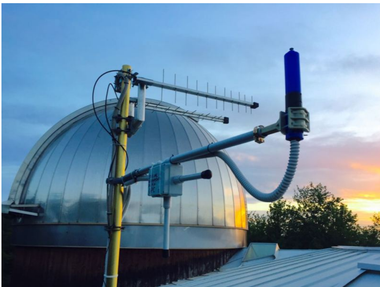
Antenna Stazione rilevamento fulmini - CEDaM OPC