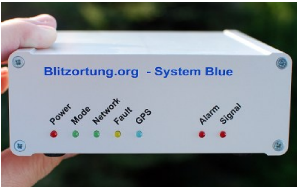
Centralina rilevazione fulmini - System Blue CEDaM OPC