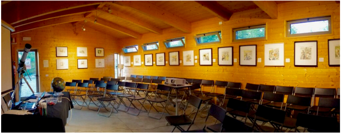
La mostra di arte