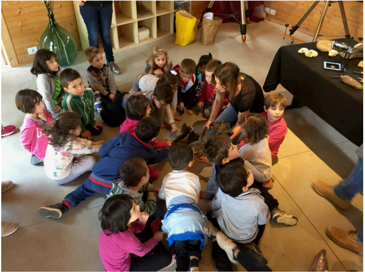
Attività con le scuole