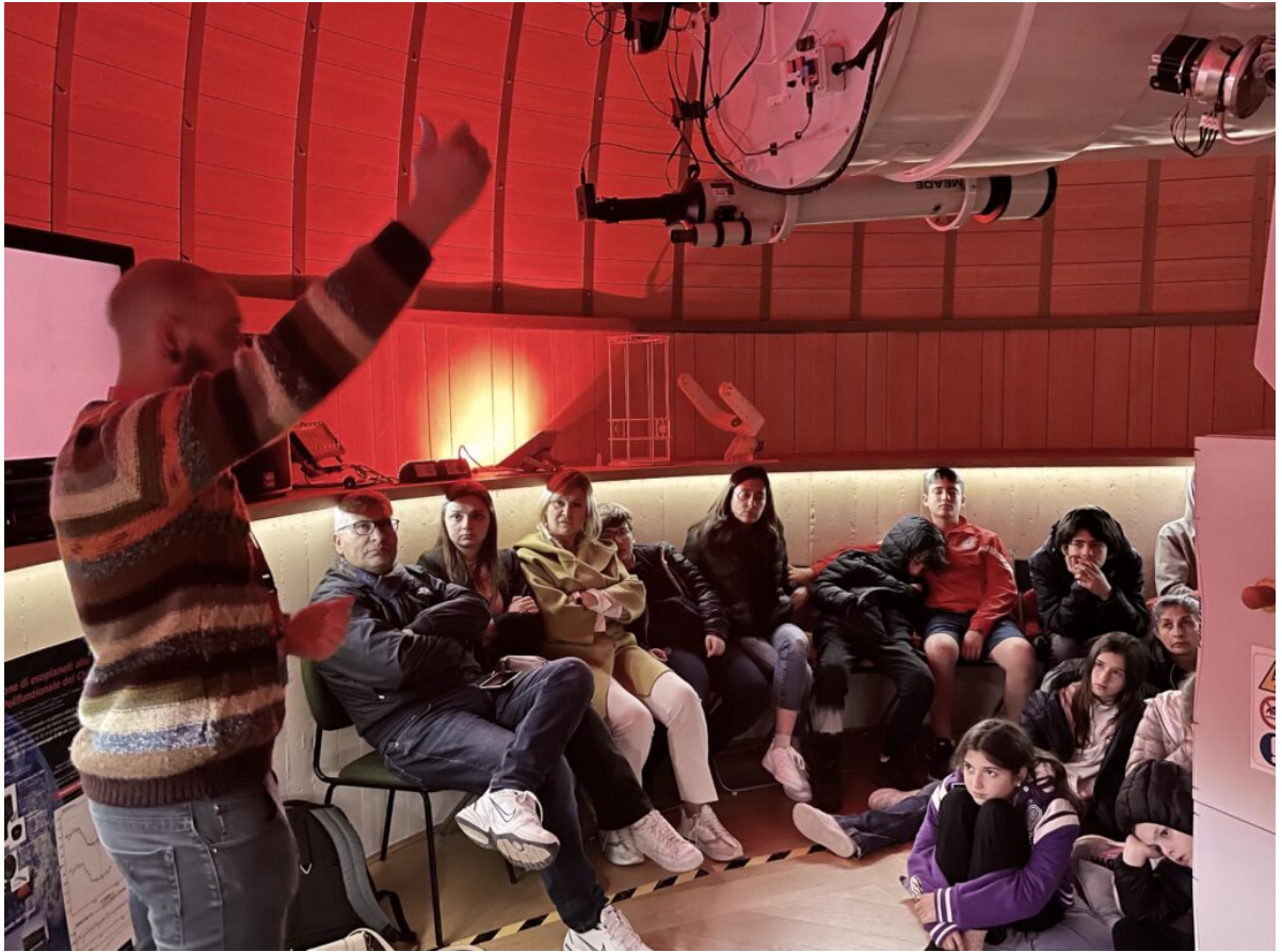
Attività in Cupola