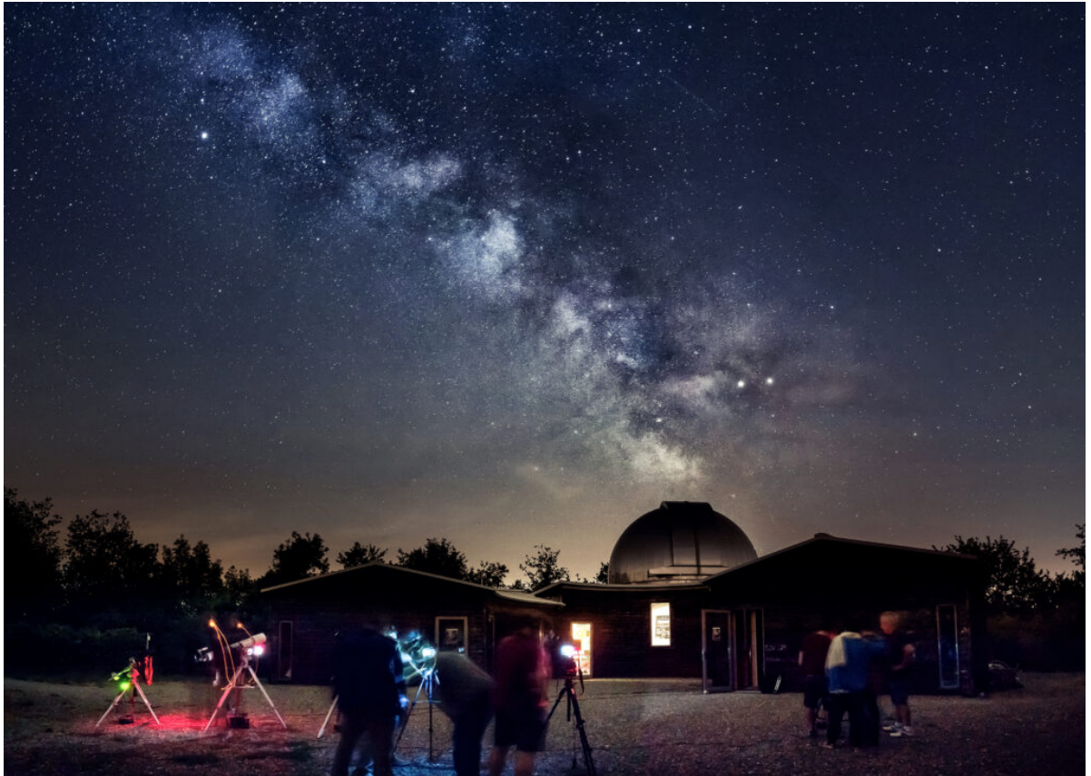
La via lattea