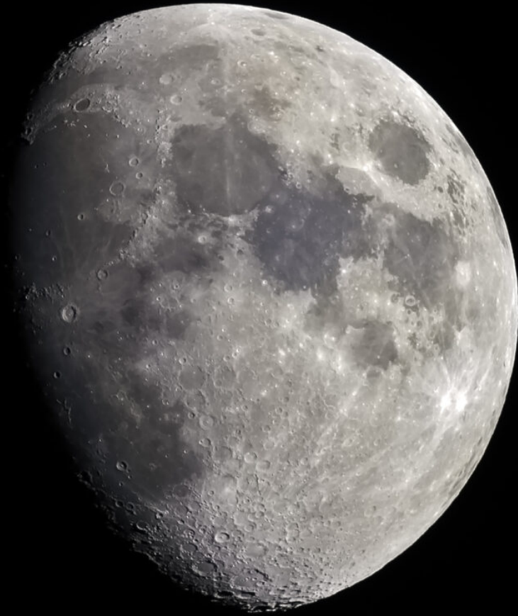
Luna - Amici OPC - 06/04/2017 - MTO 1000 f/10 - 5 foto da 1/200 sec 200 ISO su Canon EOS 600D