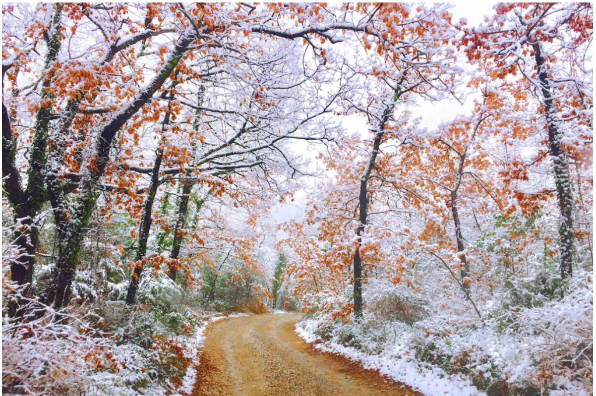
Il magnifico Parco Botanico