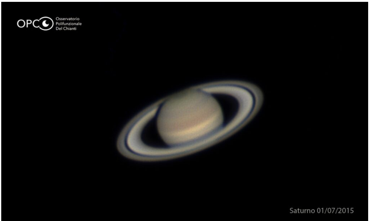
Saturno e i suoi anelli