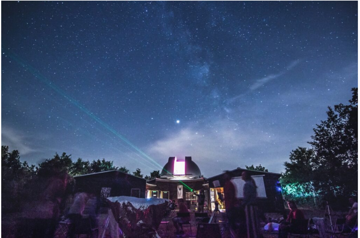
■ Orientamento celeste