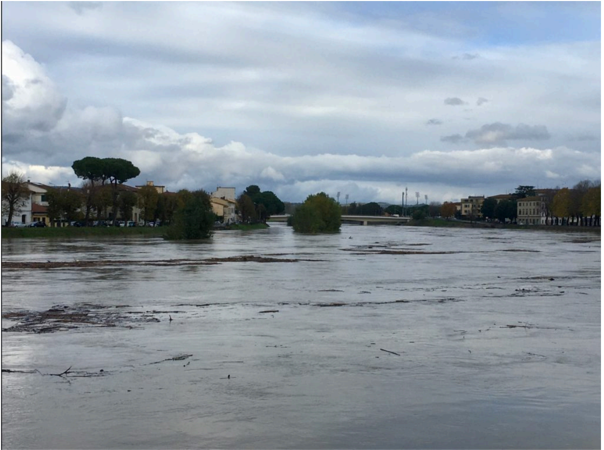
■ Piena dell'Arno a Empoli il 17/11/2019