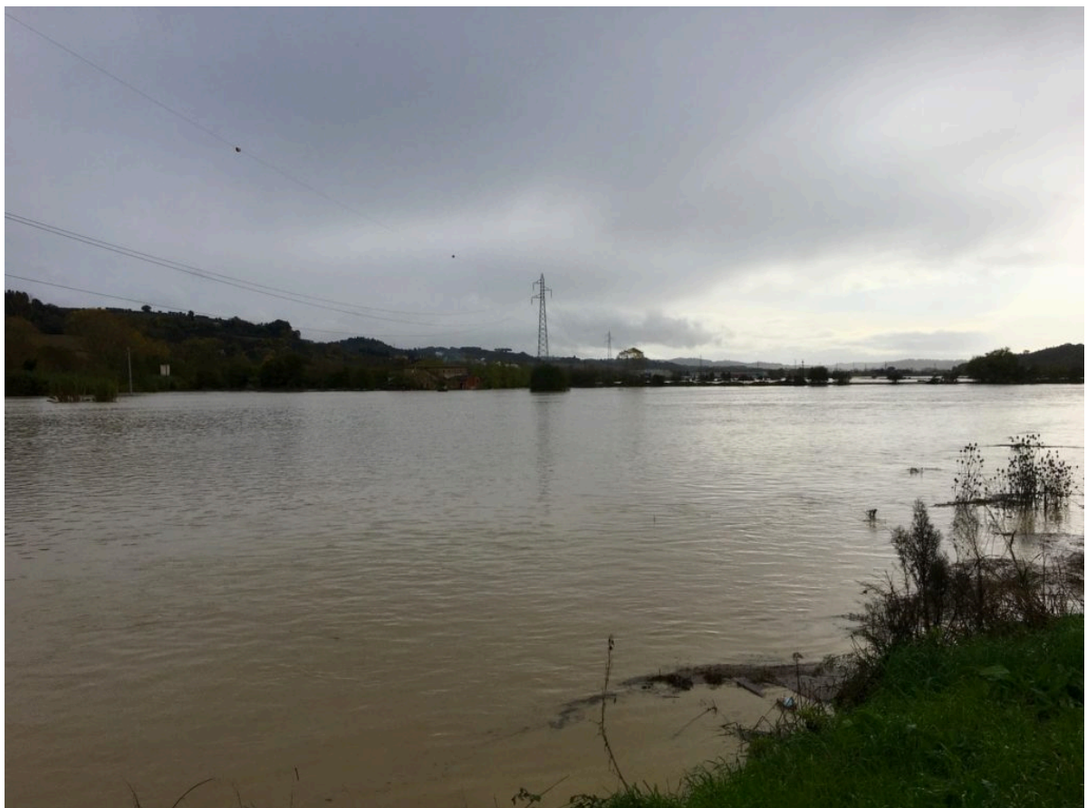
L'Elsa esonda tra Poggibonsi e Certaldo il 17/11/2019